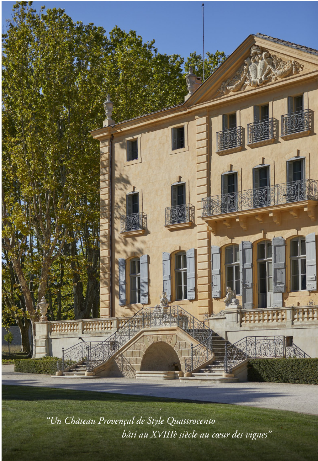
“Un Château Provençal de Style Quattrocento bâti au XVIII e siècle au cœur des vignes”