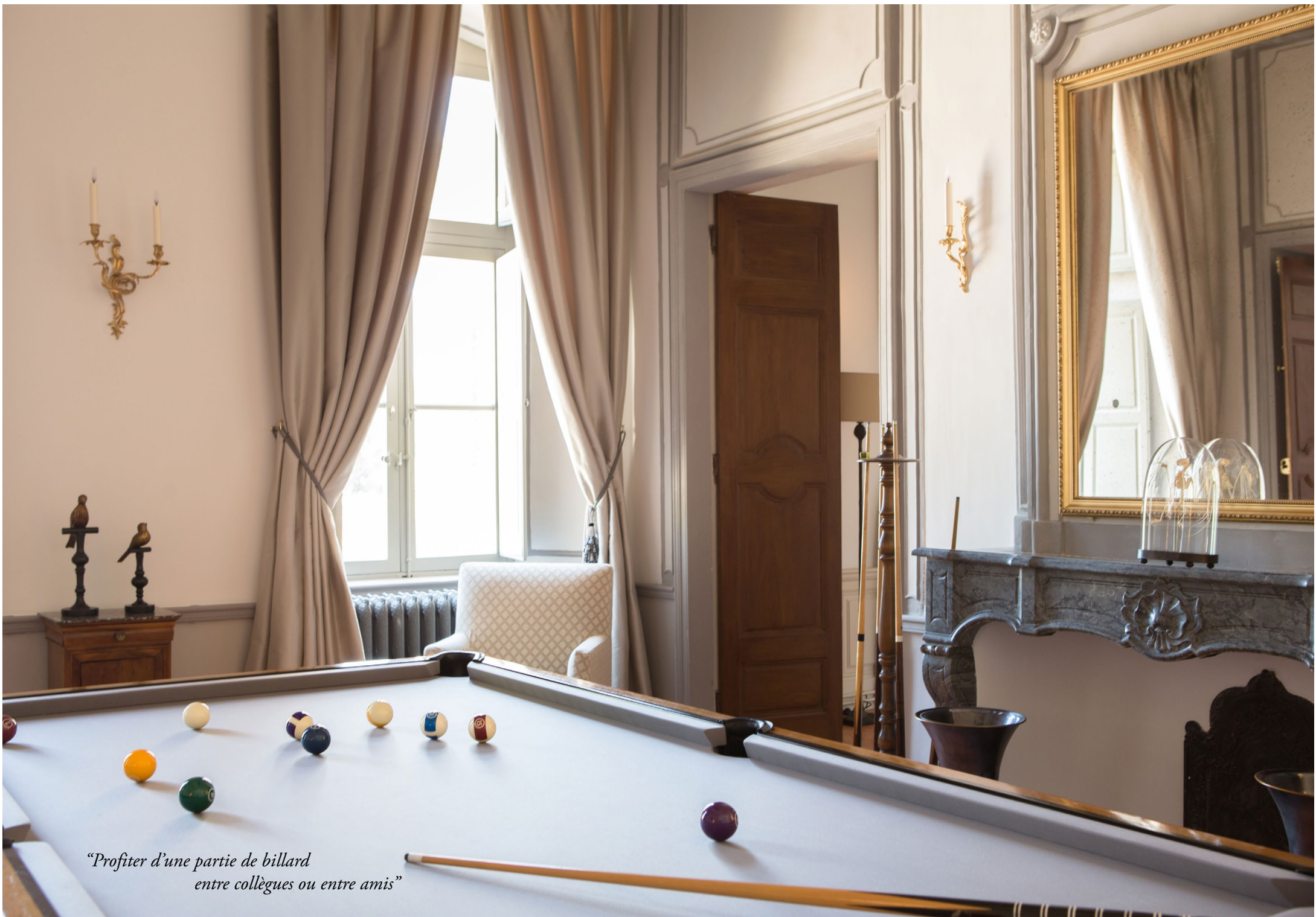
“Profiter d’une partie de billard entre collègues ou entre amis”