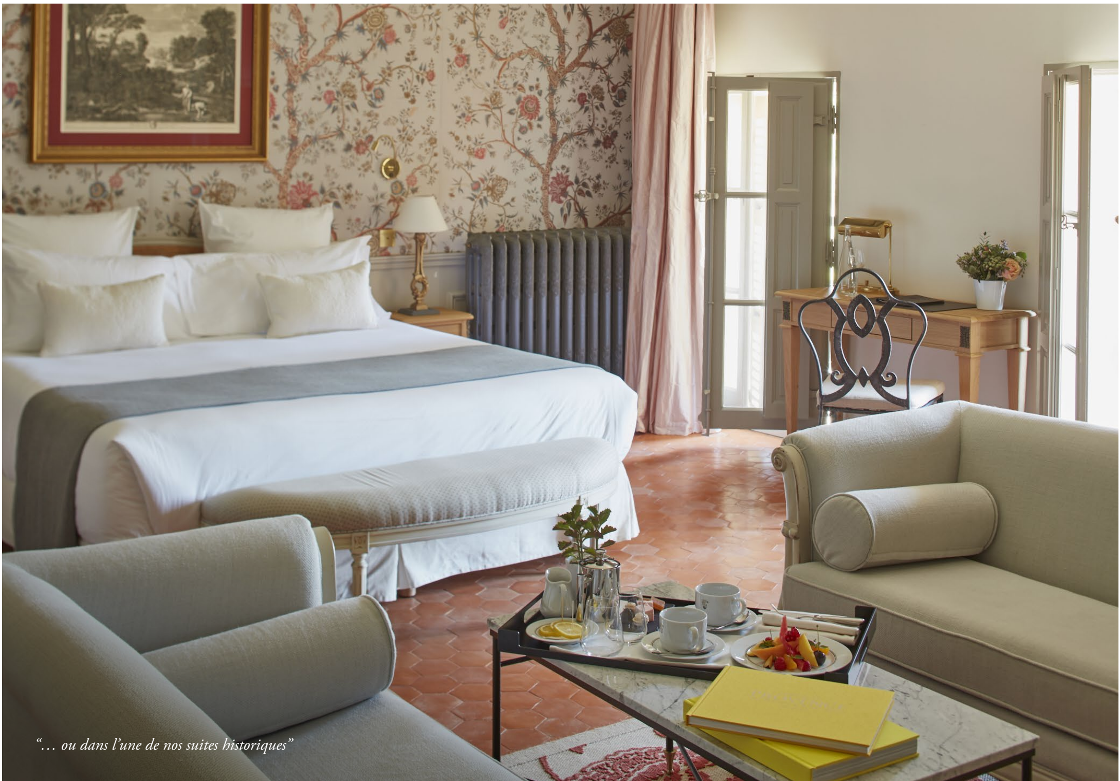
“... ou dans l'une de nos suites historiques”